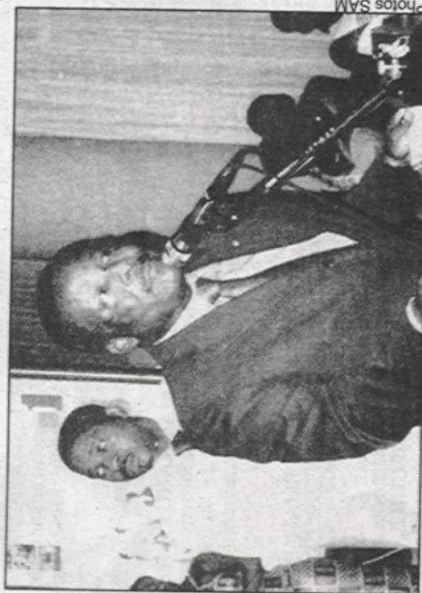
Le ministre de la Culture, Pierre Amoughe Mba a tenu à redorer le blason du Comiga.

Au-delà de la remise des cadeaux à la Miss et ses dauphines, cette formalité a été l'occasion pour Amoughe Mba de retirer quelques épines plantées dans le pied du Comiga.